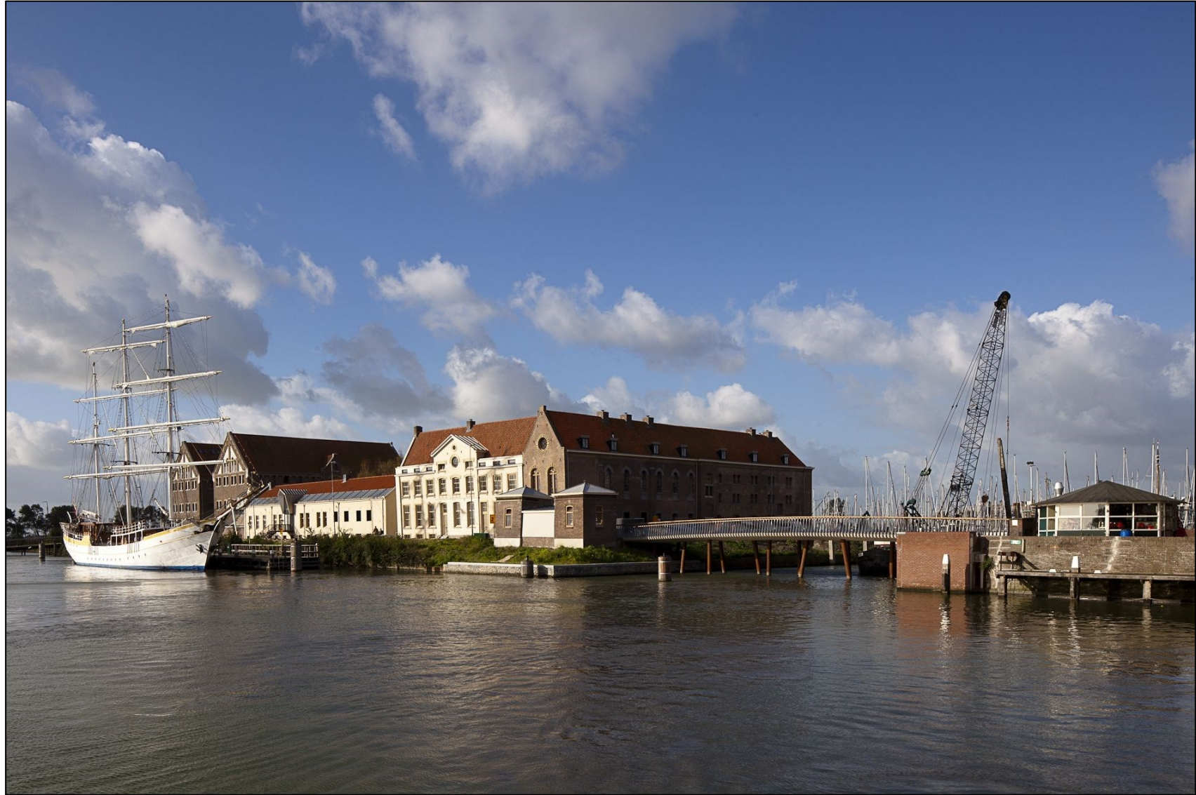
Foto: het Oostereiland, een mooi voorbeeld van een geslaagde herbestemming