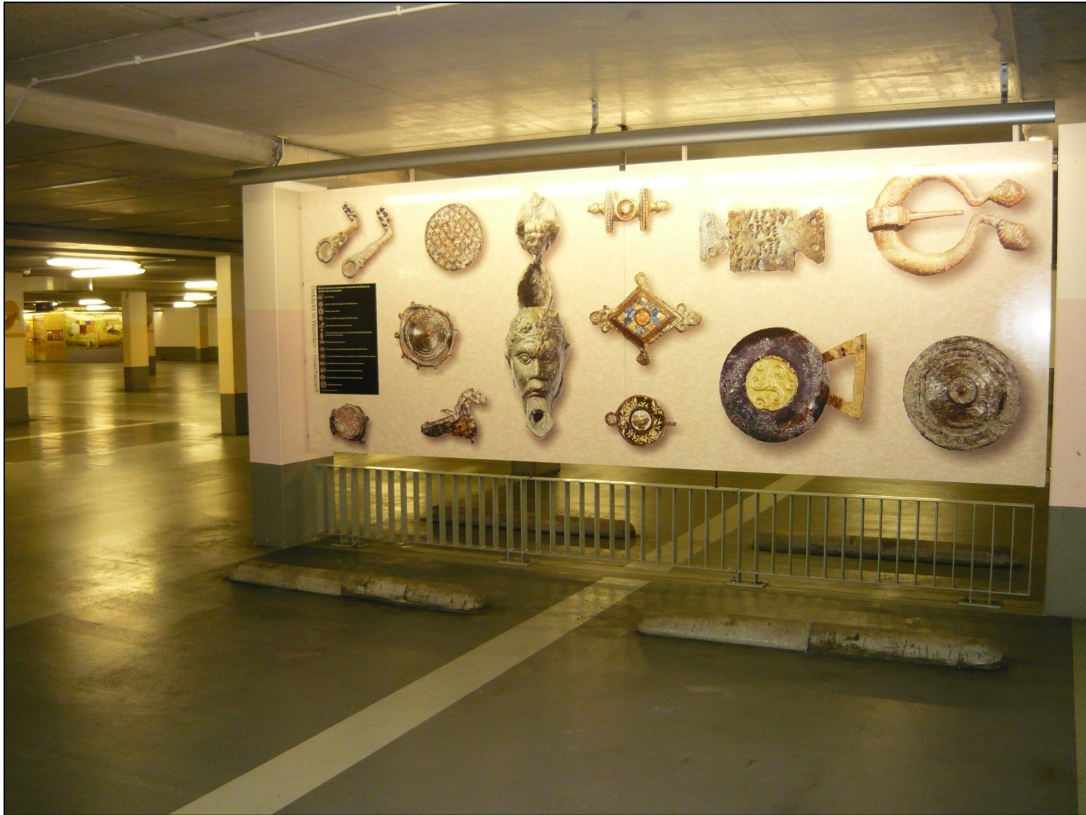
Foto: Parkeergarage Castellum, Woerden