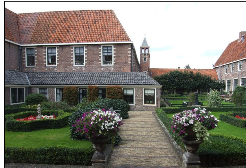
Foto: de binnenplaats van het Oude Mannenhuis en het Oude Vrouwenhuis (St. Pietershof)

Dat Hoorn centrumstad is geworden en gebleven, heeft zeker te maken met de strategische ligging van Hoorn aan het water. Maar dat Hoorn in de 19 e eeuw op het spoornetwerk is aangesloten, is daar ook belangrijk voor.