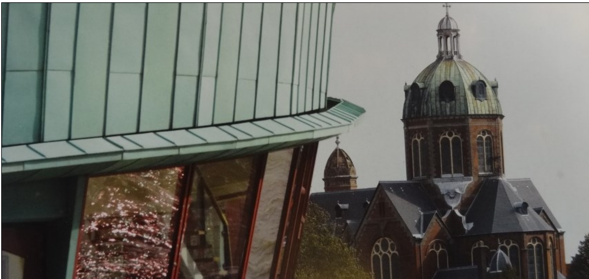
De Cyriacuskerk met op de voorgrond theater Het Park