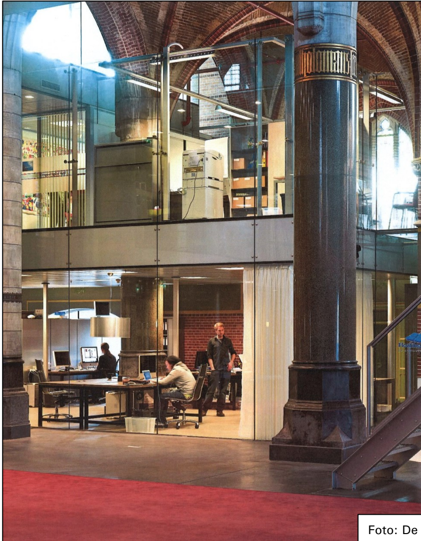
Foto: De Sint-Annakerk in Breda, een goed voorbeeld van herbestemming van een kerkgebouw