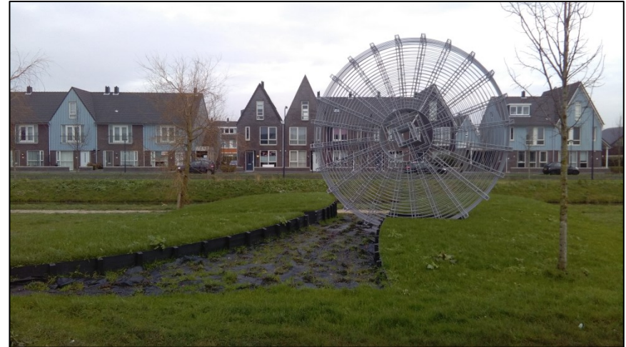
Het rad van de Bangert – het origineel en de kunstzinnige verwijzing in de Bangert en Oosterpolder