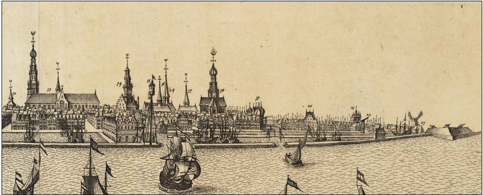
(Tekening van Hendrik Cornelisz Pot, 1650)

Foto van de voorkant: de Roode Steen vanaf de Waag