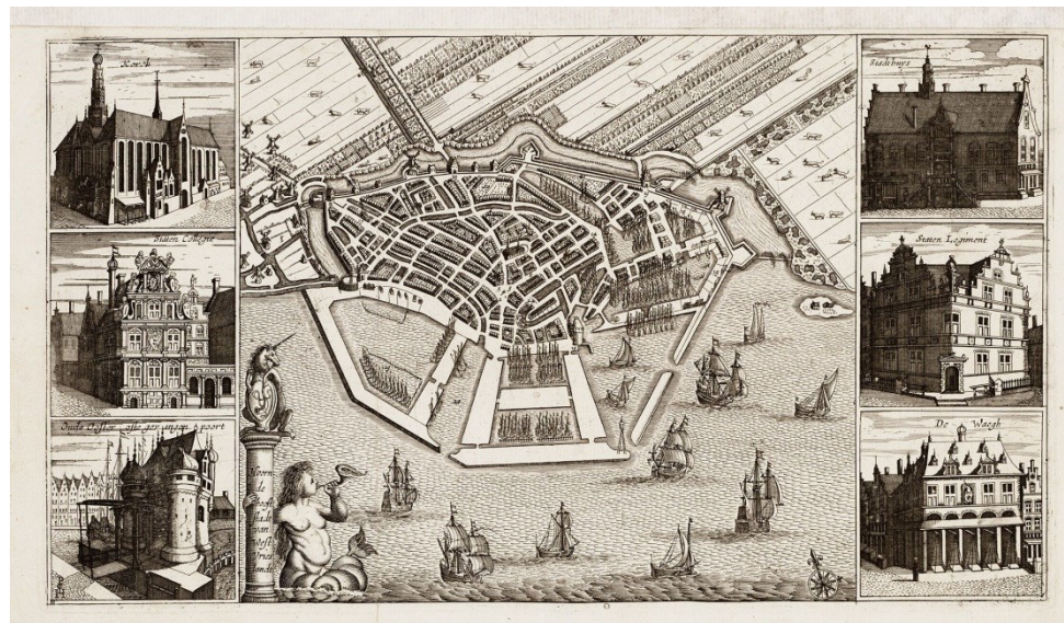
Tekening: Hendrik Cornelisz Pot, 1648?

Daarnaast biedt Het Verhaal van Hoorn een basis voor de uitwerking van het (erfgoed)beleid. Van een betere bescherming van de linten in de dorpen tot het handhaven en versterken van de kwaliteit van de openbare ruimte in de binnenstad. Op die binnenstad ligt een zwaartepunt, niet alleen vanuit haar lange historie, maar ook vanuit andere beleidsterreinen. De binnenstad blijft het 'centrum' van veel activiteiten. Daarnaast willen we zeker ook het erfgoed in de dorpen Zwaag en Blokker en in de wijken beschermen.