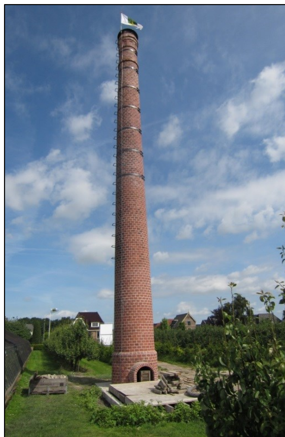
Foto's: de afmijnzaal en de gerestaureerde schoorsteen in Blokker

Ambitie: samenwerking kerkbesturen faciliteren De gemeente juicht deze samenwerking toe en wil daarom het platform faciliteren op organisatorisch gebied.