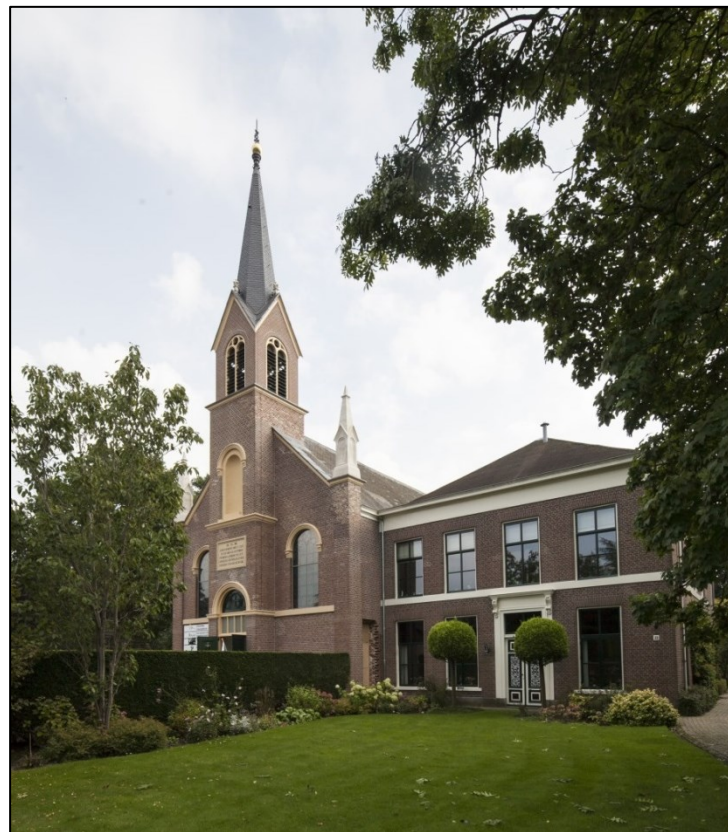
Foto: de Michaelskerk in Blokker

Hoorn wil een actieve rol nemen bij het herbestemmen van religieus erfgoed, waarbij het karakter en de uitstraling behouden blijven. Denk hierbij aan de bibliotheek in de Noorderkerk of de herbestemming van de St. Michaelskerk in Blokker. Ook door het gebruik van religieus erfgoed wordt dit cultuurhistorisch erfgoed beleefbaar, zoals de toren van de Grote Kerk voor diverse activiteiten. We willen initiatieven voor het meer beleefbaar en zichtbaar maken ondersteunen.