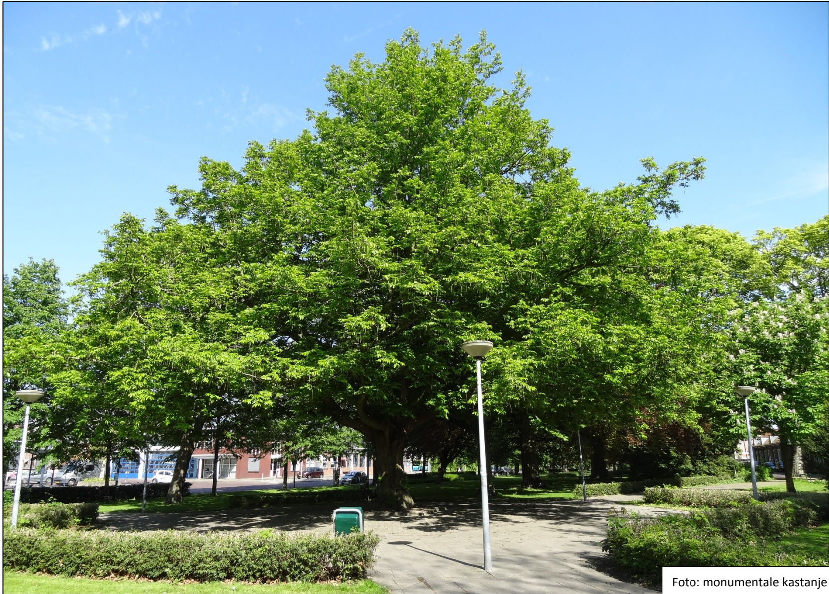
Foto: monumentale kastanje op het Noorderplantsoen