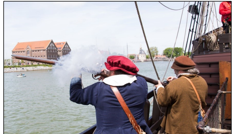
De Halve Maen is hét voorbeeld van hoe je erfgoed beleefbaar kunt maken!