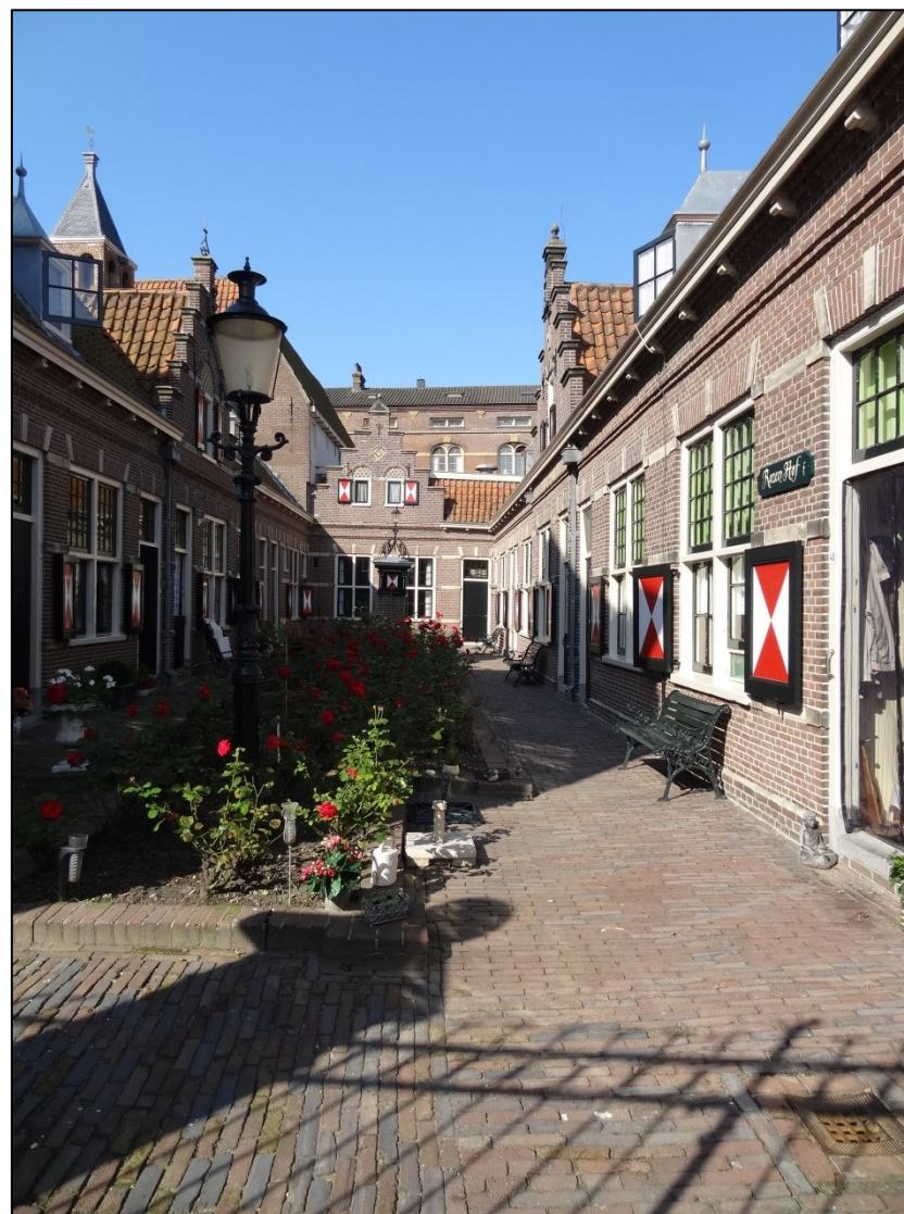
Foto: Rozenhofje aan de Spoorstraat