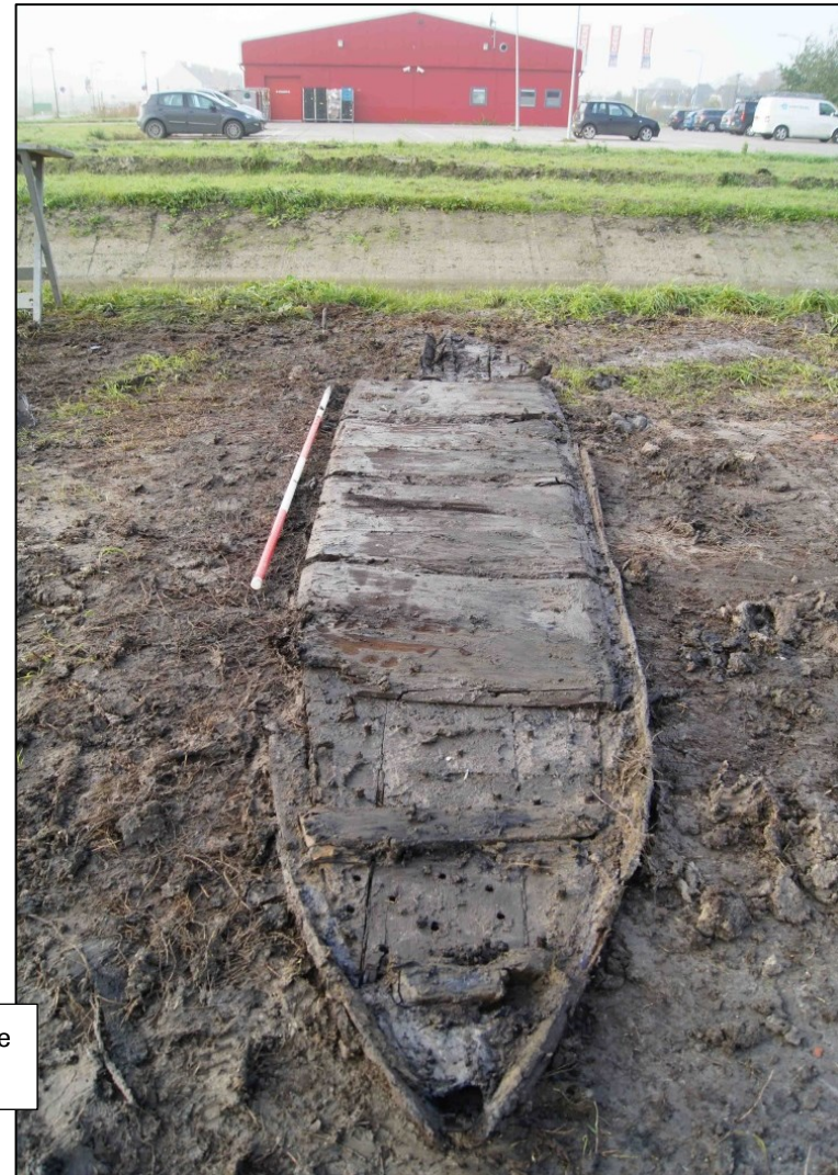
Foto: polderschuit op de bodem in de Bangert en Oosterpolder

Ambitie: samenwerkingsverband archeologie voortzetten en uitbreiden We willen het samenwerkingsverband met betrekking tot de archeologie voortzetten en waar dat wordt gevraagd, uitbreiden met bouwhistorie en cultuurlandschap.