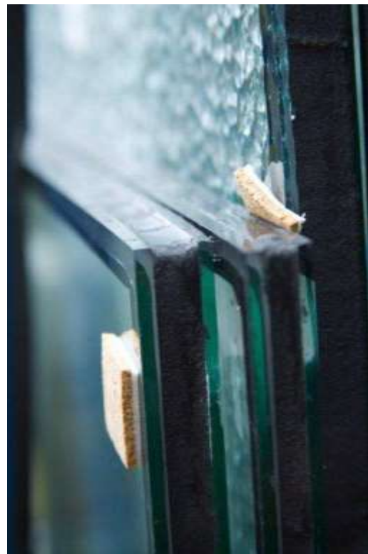
Dun dubbel glas (monumentenglas)