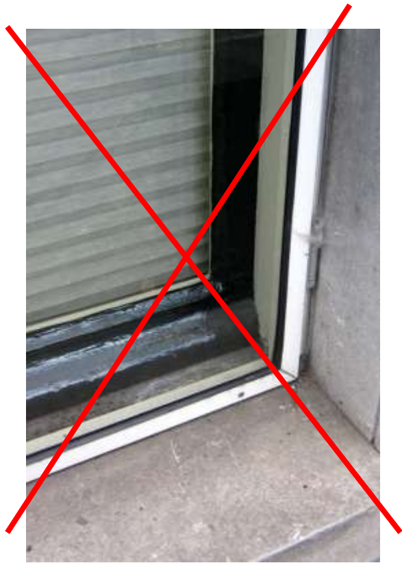
Voorzetraam (niet toegestaan)