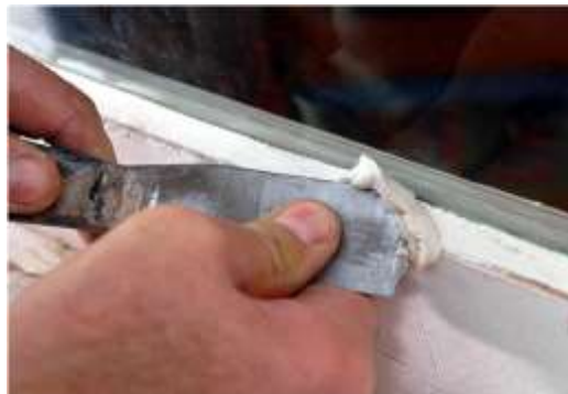
Nieuw glas geplaatst met stopverf